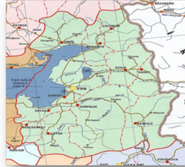
Van Mülki İdare İl Haritası

Bununla birlikte özellikle son yıllardaki özellikle düzensiz sınır geçişlerinde artan yoğunluk ve iç ve dış politika önceliklerinde değişen yapı nedeniyle Türkiye'nin göç politikalarını da güvenlik merkezli bir yapılanmayı beraberinde getirmiştir. Göç güzergahında yer alan Suriye ve Irak sınırında olduğu gibi İran sınırında da göçmenlerin ülkeye girişini engellemeye yönelik politikalar geliştirilmiştir. Bu kapsamda Türkiye'nin dünyadaki genel eğilime uyarak uygulamaya koyduğu duvar politikası, İran sınırında da kendisini göstermiştir. Türkiye, İran ile olan sınırın Van il sınırlarını oluşturan 295 kilometrelik bölümüne duvar inşa etmektedir. Duvarı teknolojik donanımlarla güçlendiren Türkiye, özellikle 2021 sonrası dönemde kolluk kuvvetlerini de yoğun şekilde duvara entegre etmiştir.