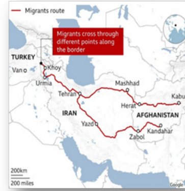
Afganistanlı Göçmenlerin İran Üzerinden Türkiye'ye Giden Yolları